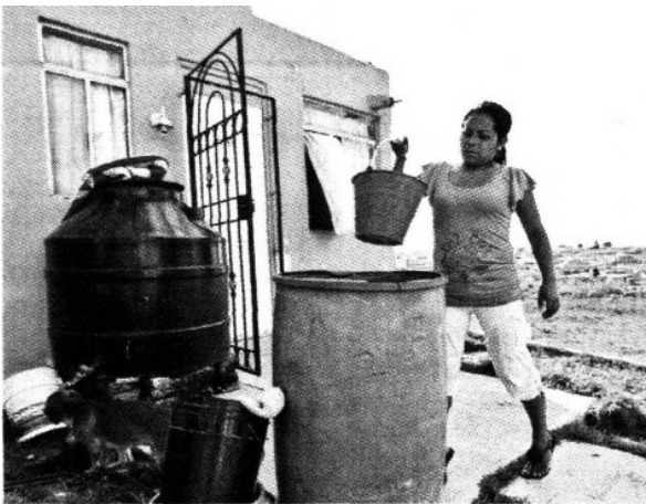
> A 500 metros del fraccionamiento hay dos tiraderos de basura.