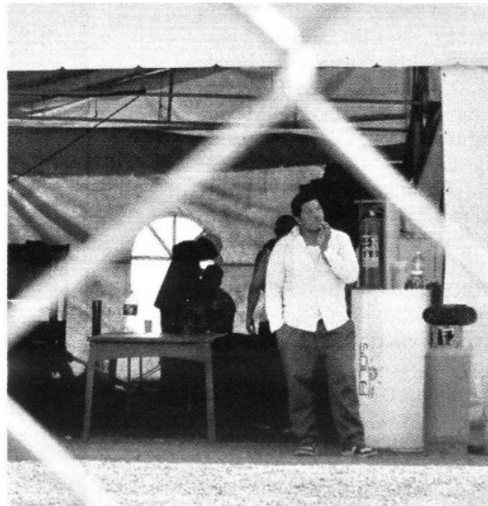
> El albergue provisional ya fue amueblado.

Sep. 30. El Secretario de Gobierno mexiquense, Ernesto Nemer, asegura en entrevista que la construcción del albergue será terminada a finales de año.