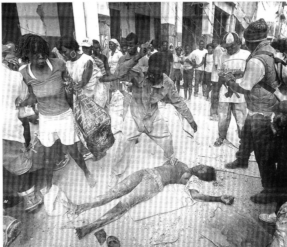
En la capital, otra víctima de las disputas por las provisiones de comida

○ El comandante general Ken Keen, a cargo de la asistencia de EU para Haití, estima que los muertos podrían ser 200 mil.