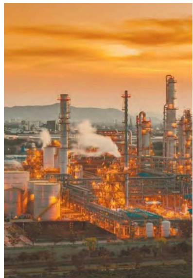
La firma regia lideró también en el 2T20 en el S&P Mila Pacific Alliance Select.

IPSA de Chile ganó 13.5%, Colombia logró un avance marginal de 1.4% del S&P Colombia BMI, mientras que el S&P/BMV IPC retrocedió 8.73% en el trimestre. El reporte indica que desde antes de la crisis sanitaria la región ya enfrentaba problemas internos importantes: los conflictos sociales en Chile, los problemas económicos en Argentina y la inestabilidad política en Brasil, entre otras cuestiones. “Adicionalmente, la pandemia del siglo y el daño económico que está dejando en su camino probablemente dificultarán la recuperación”, advirtieron.