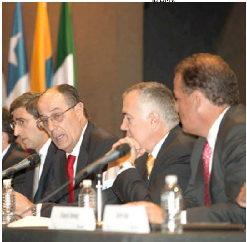
Jaime Ruiz Sacristán, nuevo presidente de la BMV, señaló que como todo proceso de arranque, éste es un mercado común que se empezará a dar a conocer.