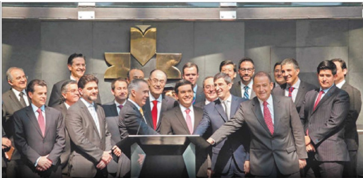
Los representantes de los mercados bursátiles de México, Colombia, Chile y Perú coincidieron en la conveniencia de homologar las tasas impositivas en el Mercado Integrado Latinoamericano, que ayer formalizó la incorporación de la Bolsa mexicana.