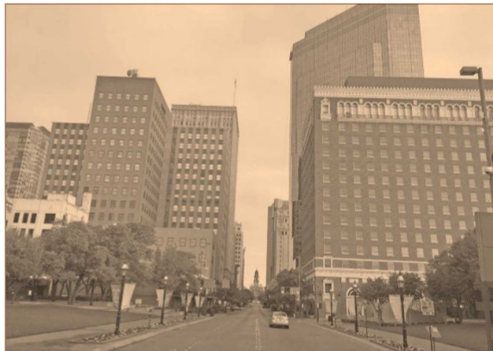
El desarrollo de las economías en el norte de Texas se debe a la mezcla de industrias de servicios, tecnología y comercio.