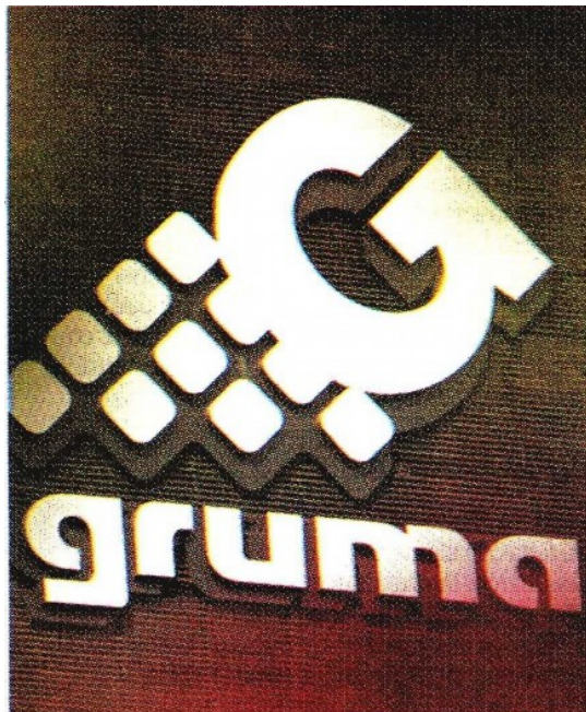
La deuda de la empresa es US1,200 millones.

Asimismo, construye dos fábricas de tortillas, una en EU y otra en México.