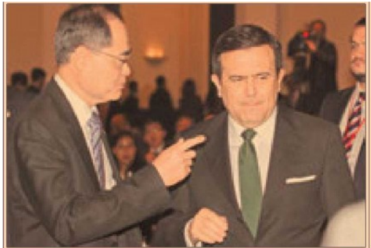
Posición geográfica y enfoque de las economías hacen complementarios a México y Singapur.