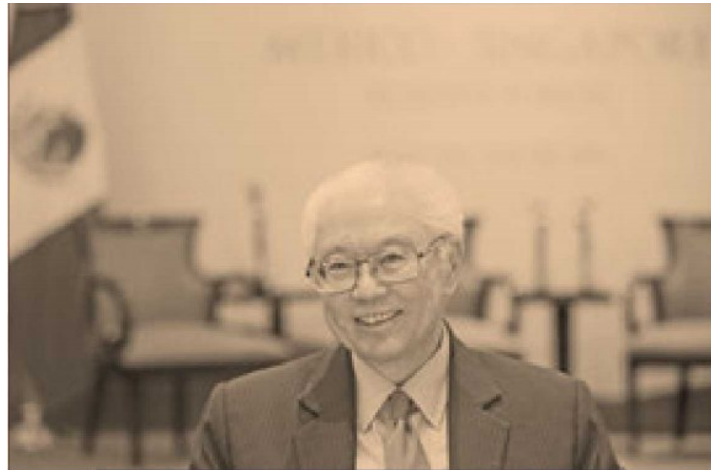
Lim Hng Kiang , ministro de Comercio e Industria de Singapur.