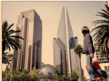
Los inversionistas y analistas estarán atentos a los informes anuales de las emisoras, que se darán a conocer en los próximos meses del año.