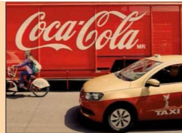
FEMSA, con todas sus divisiones, es la tercer emisora que más aporta EBITDA de la muestra del IPC, sólo por detrás de AMX y Grupo México.