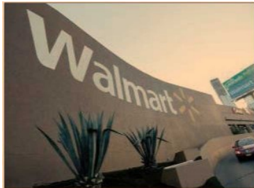
Walmex es una de las cinco emisoras que más EBITDA aporta a la muestra del IPC; en el 2016 reportó un flujo operativo de 50,149 millones.