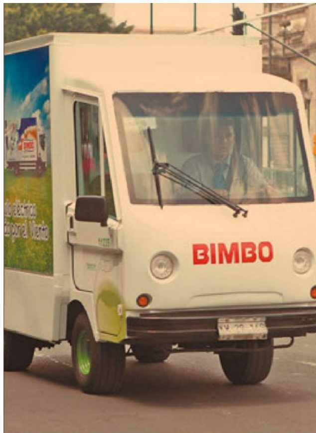
Grupo Bimbo tiene un alto nivel de deuda en dólares, por lo cual es una de las firmas más golpeadas por la depreciación del peso.