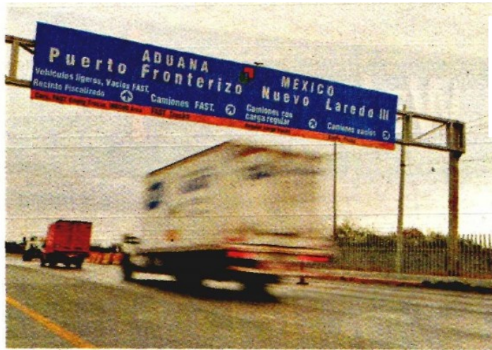
Más inversión y empleo con el libre comercio.