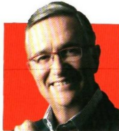
Ricardo Salinas Pliego

El bajo ritmo que mantiene el desarrollo de infraestructura y el nivel de apalancamiento en dólares inciden en la perspectiva que se tiene sobre la emisora.