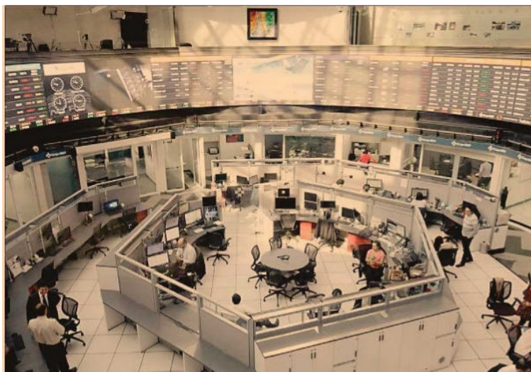
Las empresas públicas listadas en la Bolsa Mexicana de Valores tuvieron resultados neutrales y, en algunos casos, negativos.

27% REPUNTÓ el EBITDA de la embotelladora de Coca-Cola.