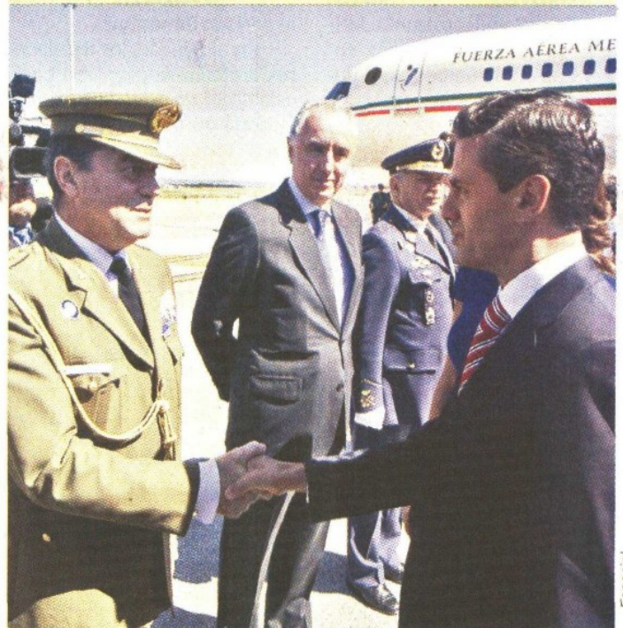
■ El Presidente Enrique Peña arribó ayer a España.