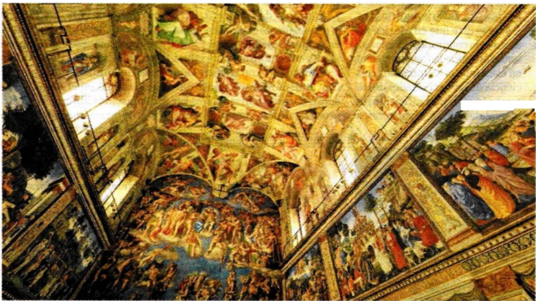
La copia monumental tendrá 27 metros de alto, 78 metros de largo y 36 metros de ancho.