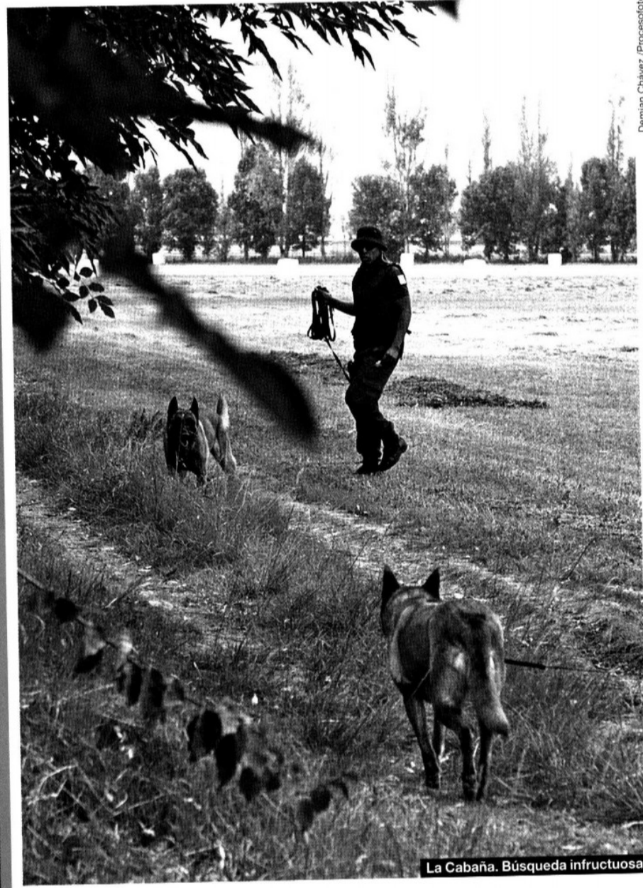
Demian Chávez / ProcesoFoto