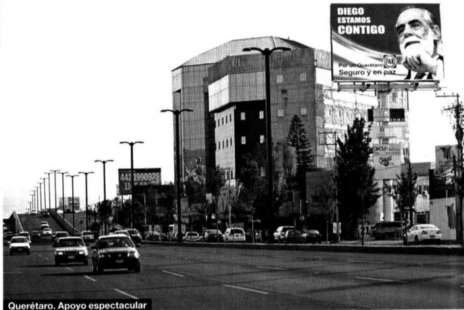
Querétaro. Apoyo espectacular