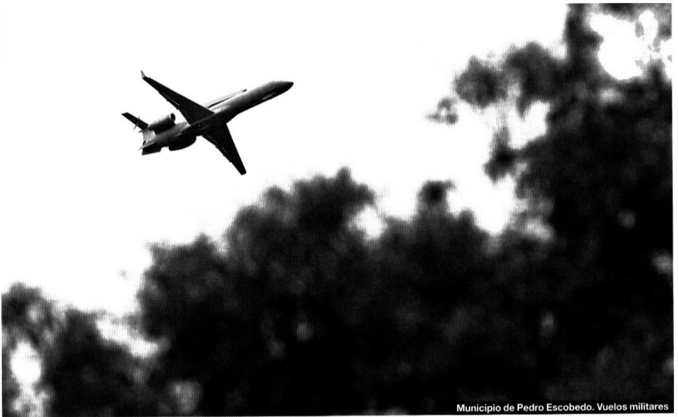
Municipio de Pedro Escobedo. Vuelos militares