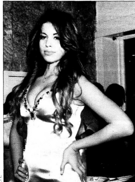
EN LA MIRA. Silvio Berlusconi, 75 años, podría ser llamado a declarar el próximo fin de semana. Imagen de archivo de Ruby.