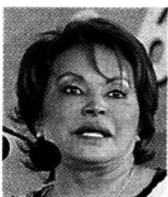
Elba Esther Gordillo Dirigente del SNTE (19/nov/2010)

“ En muy poquito tiempo vamos a presentar un sistema universal de evaluación para que digan ‘no tenemos miedo de que nos evalúen’. Lo que nos preocupa es que lo hagan desde una visión de inequidad”