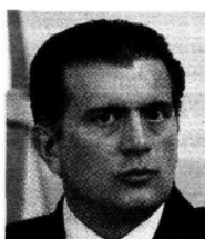
LUJAMBIO dijo que se trata de un sistema de evaluación universal.

Los maestros que se incorporan al nivel A reciben un estímulo salarial que representa más de 20 por ciento de su salario base, mientras que los que se ubican en el nivel E reciben más de 200 por ciento.