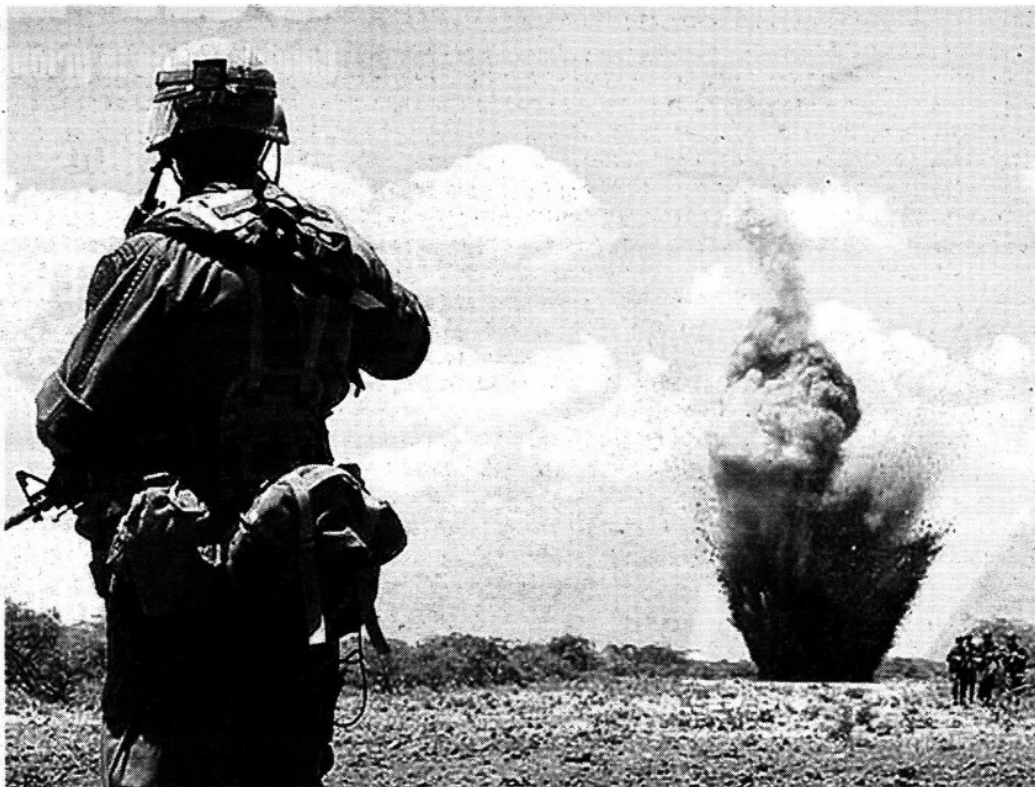
Aeródromos destruidos por personal militar en la sierra de Sinaloa en 2009