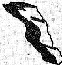
BAJA CALIFORNIA SUR

En Baja California Sur sí hubo un repunte del voto en favor del PRI. Hace tres años no ganaron una sola alcaldía; esta vez se llevaron La Paz y Loreto: