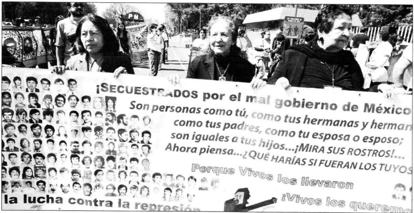
Integrantes de H.I.J.O.S México y del Comité Eureka, encabezados por Rosario Ibarra, protestan dentro y fuera del Campo Militar número uno, exigiendo el retorno con vida de los desaparecidos políticos

Fax: 5605-2099 • juliohdz@jornada.com.mx • www.twitter.com/julioastillero