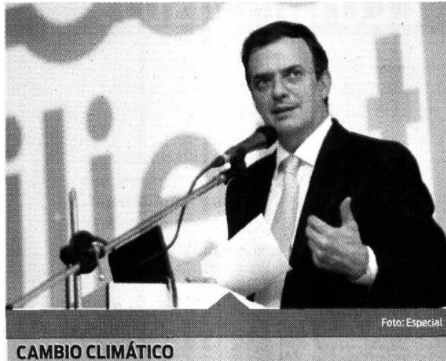
CAMBIO CLIMÁTICO