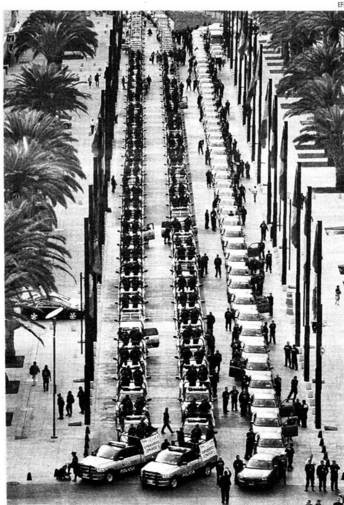
Presentación del personal operativo en el DF