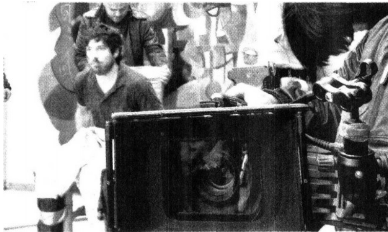
ALTA TECNOLOGÍA. La filmación se realizó con la cámara digital Red One