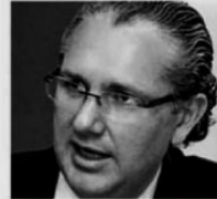
Oficial Mayor Nicolás Kubli Albertini