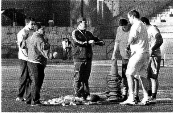
> Entrenadores dijeron estar de acuerdo con partidos interligas.