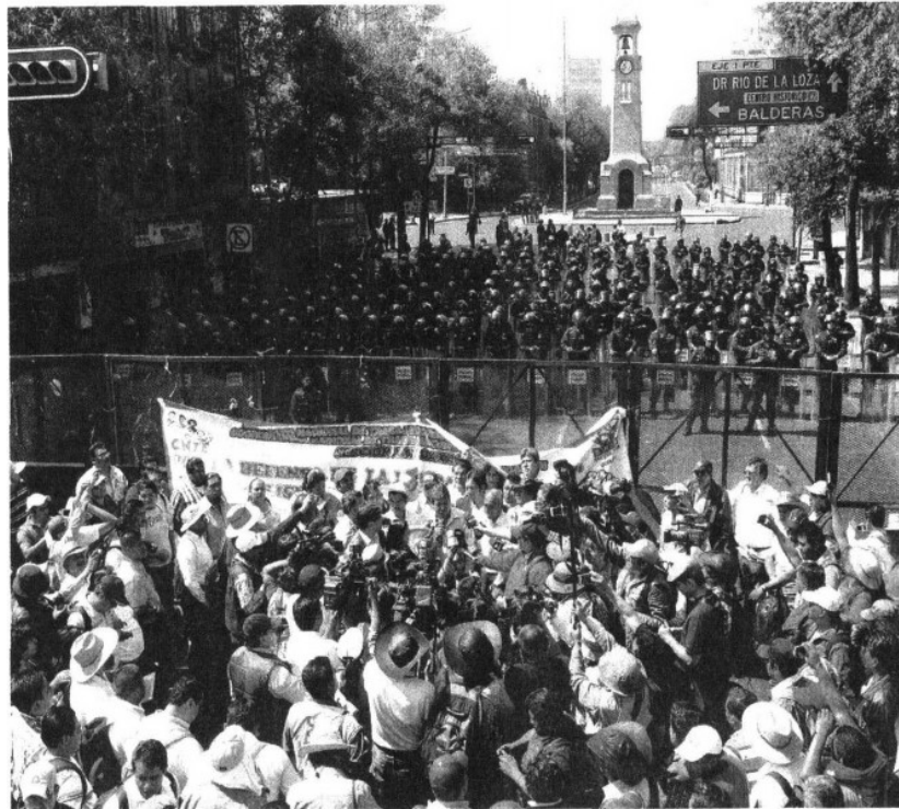
DF. Integrantes de la CNTE se manifestaron afuera de la Secretaría de Gobernación