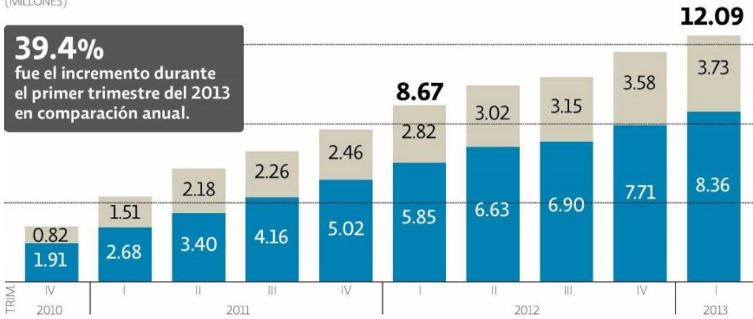
Suscripciones de banda ancha móvil en México ● MÓDEM MÓVIL ● TELÉFONOS CELULARES (MILLONES)

Las suscripciones de banda ancha móvil en México se incrementaron 39.4% durante el primer trimestre del 2013 en comparación anual, al pasar de 8.67 millones en los primeros tres meses del 2012, a 12.09 millones para el mismo periodo de este año.