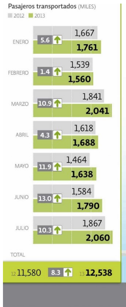
GRÁFICO EE: ALMA BLANCAS.

líneas aéreas nacionales operan rutas hacia EU.