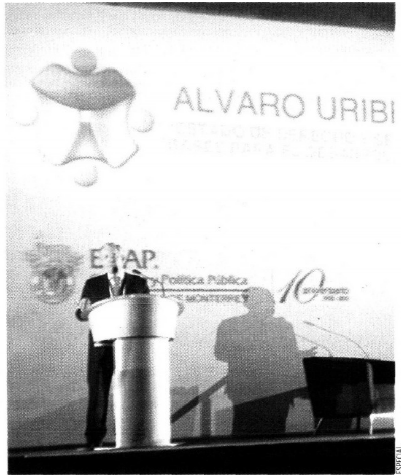
El expresidente de Colombia, Álvaro Uribe, habló sobre estado de derecho y seguridad.