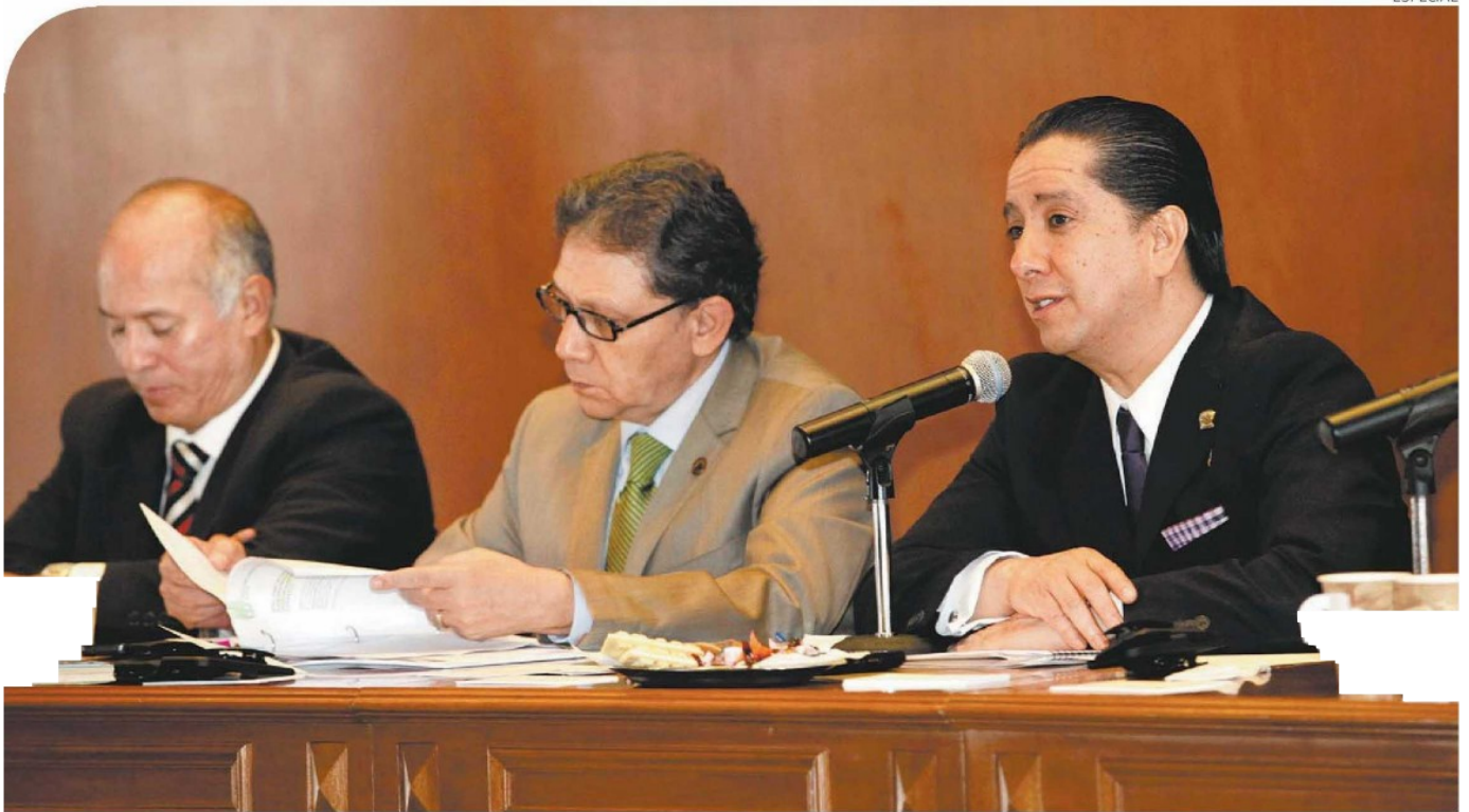
El rector de la Uaemex, Jorge Olvera García, ratificó su compromiso de campaña de elegir democráticamente a las autoridades de los espacios de la institución.