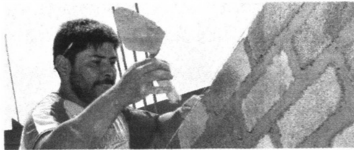
Var % del precio de los ADRs en 2013

El 56 por ciento de las compañías mexicanas que cotizan en ese mercado mantienen un desempeño negativo, lideradas por el sector de la construcción y vivienda.