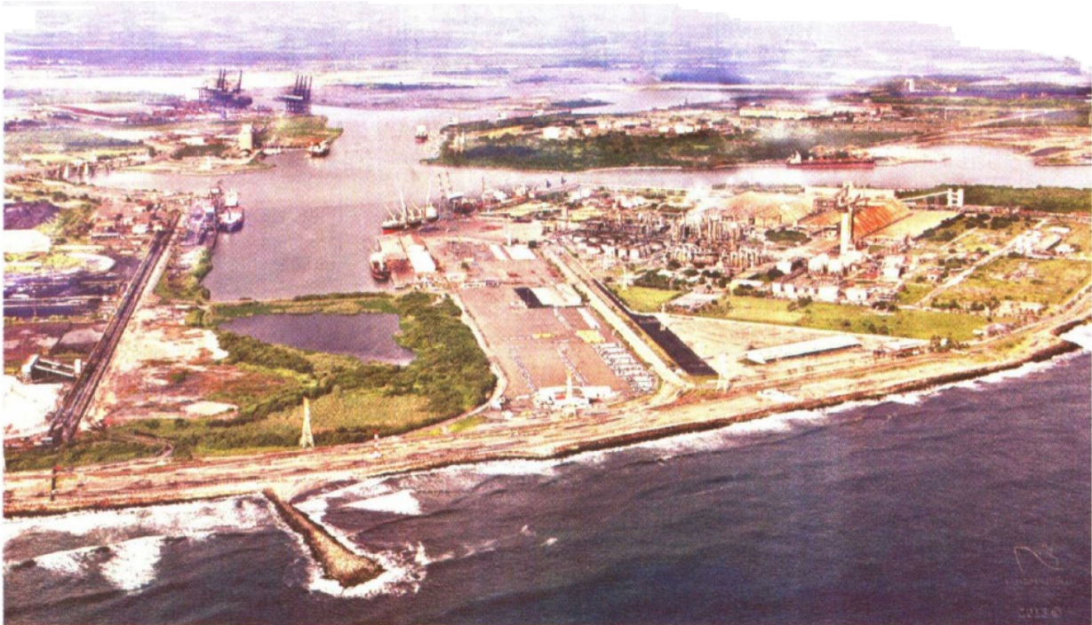
BAJO LA MIRADA MILITAR. El recinto portuario de Lázaro Cárdenas tiene 40 mil hectáreas, las cuales son vigiladas por al menos 200 elementos de la Armada.

las cosas se van a hacer con más disciplina”, comentó otro trabajador de esta terminal naviera.