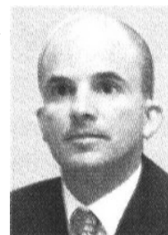
José A. González Anaya, IMSS.

El IMSS, que dirige José Antonio González Anaya , va a recibir hoy propuestas para adquirir 470 claves de medicamentos, como parte del proceso de compras consolidadas para el ISSSTE de Sebastián Lerdo de Tejada , Pemex de Emilio Lozoya Austin , las secretarías de la Defensa, que comanda Salvador Cienfuegos , y Ma-