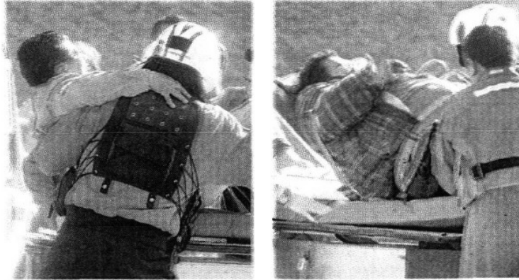
Paramédicos rescataron a los heridos.