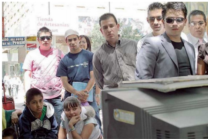
Apagón analógico sigue en la República Mexicana.

Porcentaje de la población.