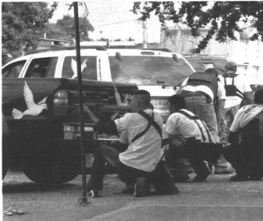
JOSÉ SERRATOS EL GRÁFICO