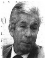
GERARDO RUIZ, de SCT

La tarea, en San Lázaro. Ahora toca el turno a la Cámara de Diputados de sentarse a discutir el contenido que debe tener la legislación secundaria en materia de telecomunicaciones, y lo hará este miércoles, después de que lo hiciera la Cámara de Senadores a finales del año pasado. Sin embargo, todas estas discusiones se llevan a cabo sin el documento que debe proponer el Ejecutivo y los expertos empiezan a dudar que se tenga listo como lo ha comentado en varias ocasiones Gerardo Ruiz Esparza ,