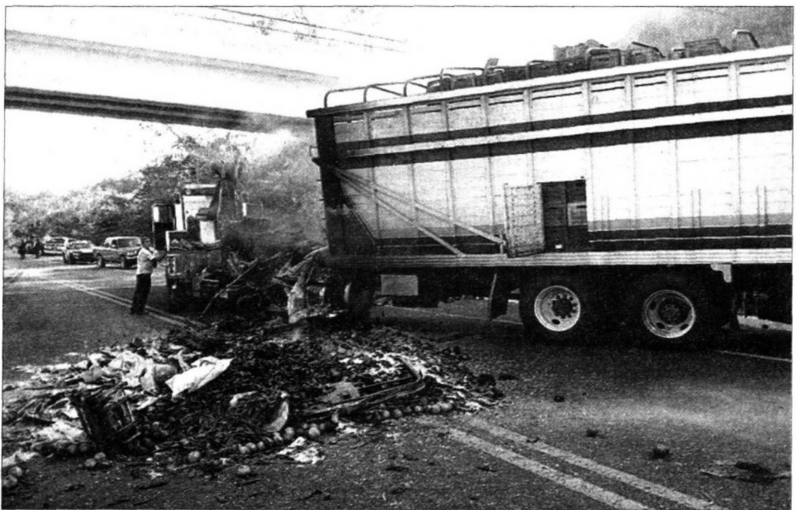
TERROR. Sujetos armados bajaron a los conductores de los vehiculos y les prendieron fuego, a la altura del municipio de La Unión.