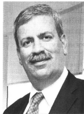
Francisco González, director de ProMéxico, prevé organizar el Mexican Fest en el Foro Económico Mundial, en Davos, Suiza.

nizar el Mexican Fest en dicho evento, con el objetivo de promover el atractivo para la inversión y los negocios en este importante evento. Se dice que hará una degustación de comidas y bebidas típicas del país, a la cual invitará a las más altas personalidades asistentes al tradicional foro de líderes globales.