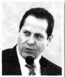
ERUVIEL ÁVILA VILLEGAS.

E l terrible tráfico de las obras de Puente Grande y la carretera Cuautitlán-Teoloyucan continúa porque siguen frenados los trabajos; pero resulta que el Instituto Nacional de Antropología e Historia tiene en suspenso precisamente parte de las obras para la ampliación del puente porque se encontraron algunos vestigios arqueológicos como un basamento y lo que podría ser un acueducto. Y si a eso le sumamos que a pesar de que hubo un acuerdo entre los gobiernos municipales de Coyotepec, Cuautitlán Izcalli, Teoloyucan y Cuautitlán para controlar el tráfico con agentes de tránsito y sólo cumple este último municipio, entonces entenderemos el porqué del desastre. Muchos tienen la esperanza de que en estos meses se agilicen las obras y el INAH haga viables los