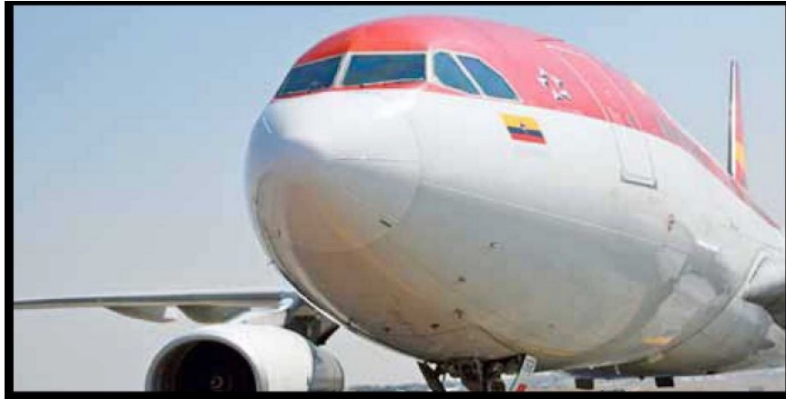
El Airbus A330 consume menos combustible y reduce emisiones de CO2.