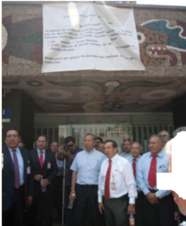
Los taxistas aseguran que las autoridades les mintieron.

Les hicieron la promesa de solucionar las irregularidades de la firma del convenio y ellos esperan que sea lo más pronto posible