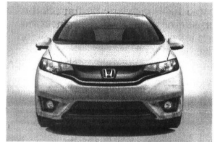
VEHÍCULO que se mostró en el festejo

Honda ya cuenta en México con otra planta de producción, en El Salto, Jalisco, donde fabrica la camioneta CR-V, una SUV que por cierto, está colocada entre los 10 vehículos más vendidos en el país.