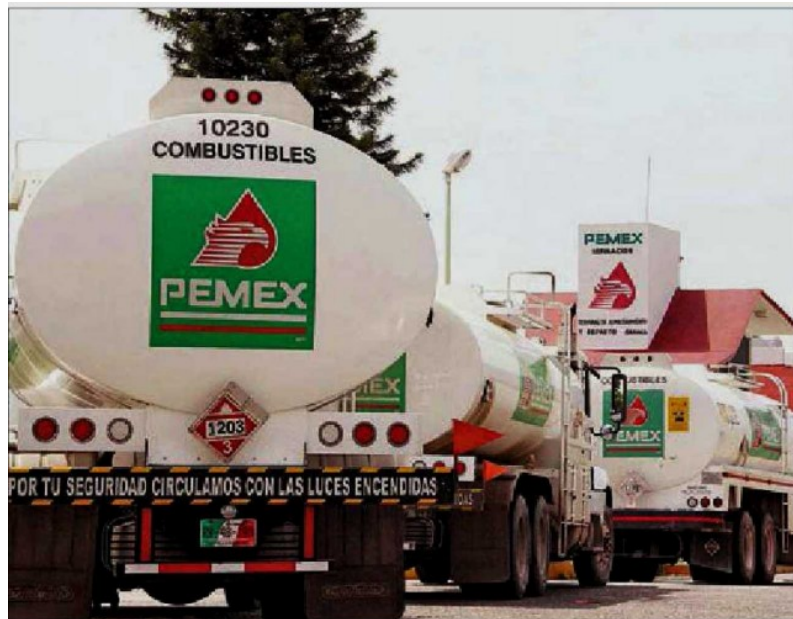
Pemex presentó esta semana a la Bolsa Mexicana de Valores (BMV) su Reporte de Resultados al 31 de diciembre de 2013, en el cual se observa que registró una pérdida neta de 169 mil millones de pesos, derivada fundamentalmente del enorme pago de impuestos a que está sujeta la paraestatal.