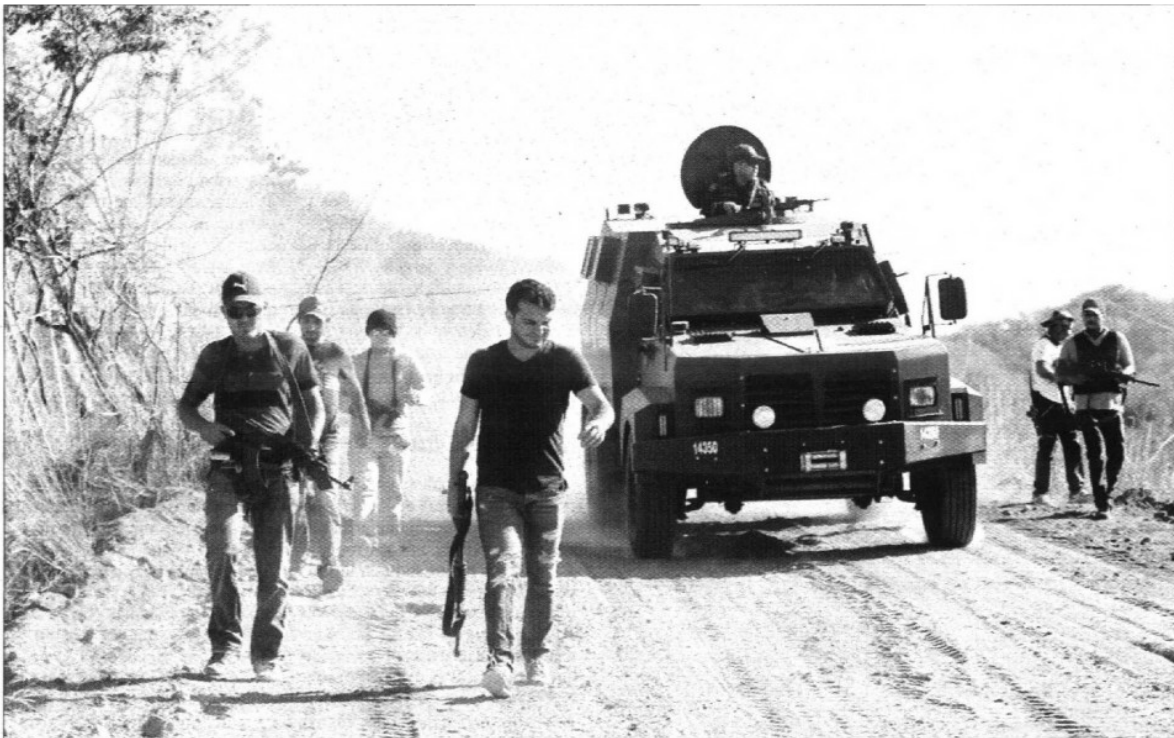
Grupos de autodefensa de Michoacán instalaron barricadas en los principales accesos de Uruapan, en busca de integrantes del cártel Los caballeros templarios . "Tenemos que actuar rápido para capturar al mayor número de ellos", aseguró ayer el comandante Cinco .