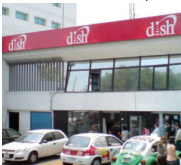
Dish comenzó la retransmisión de canales de TV abierta desde septiembre de 2013.

Además, integró el Registro Público de Concesiones y se diseñó una plataforma digital para ser consultada en línea por el público en general.