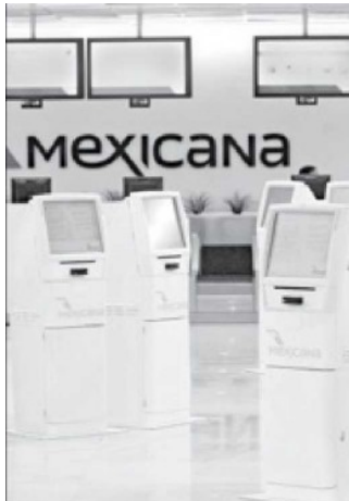
El 19 de febrero pasado la Procuraduría General de la República obtuvo de un juez una orden de aprehensión en contra del empresario.

$198 millones conformaban un fideicomiso que era para las remuneraciones de los trabajadores de Mexicana.