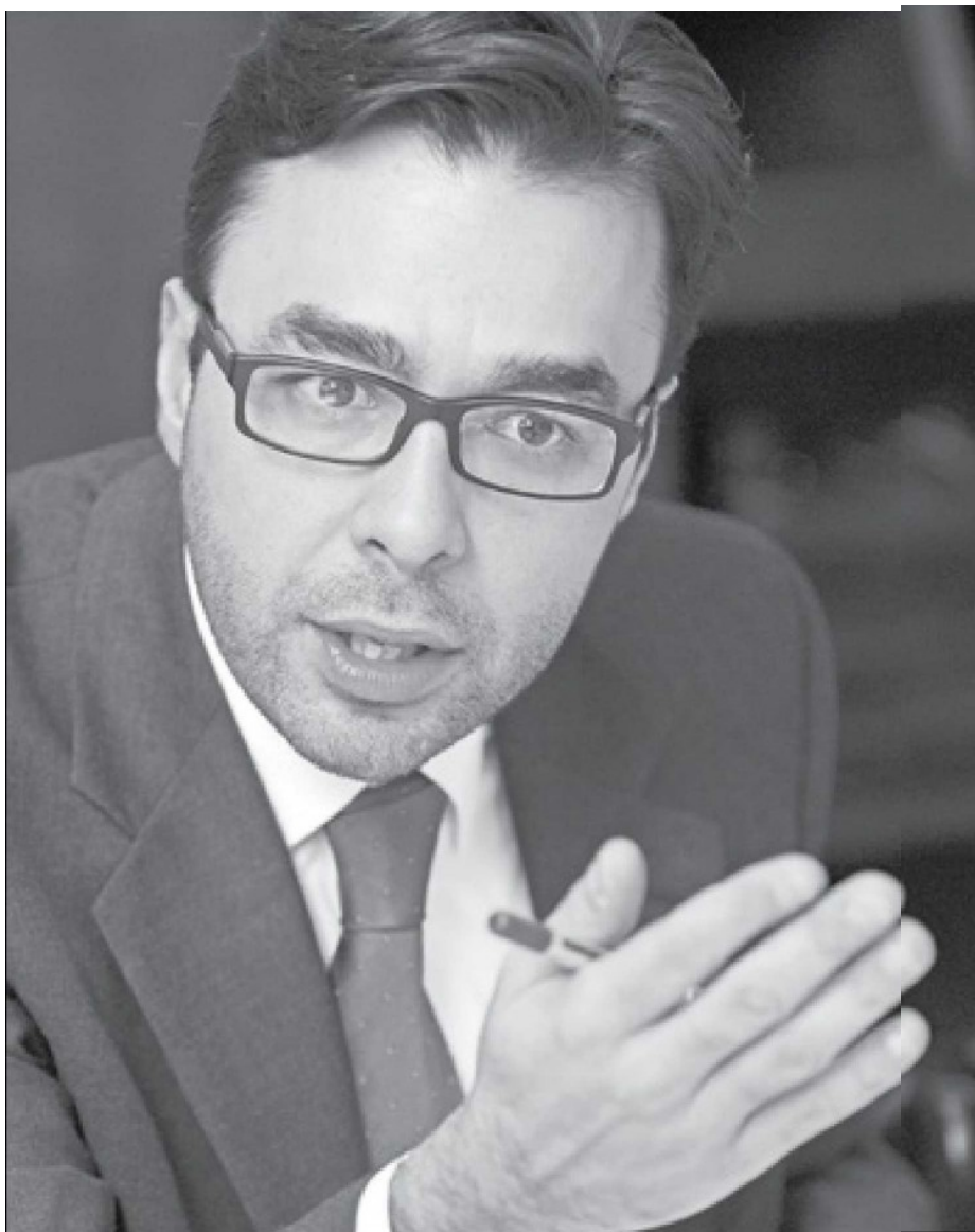
Gabriel Contreras. Presidente del Ifetel.