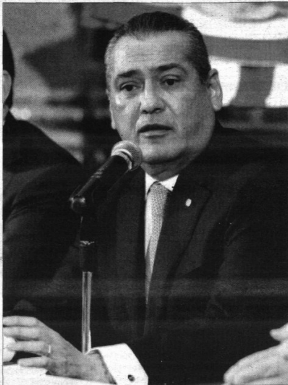
Manlio Fabio Beltrones confía en que los efectos de las reformas acabarán por ser percibidos.

■ "El PRD va a tener competencia en Morena"; la tendrá difícil el PRI por "la falta de resultados sólidos derivados del proceso de reformas"